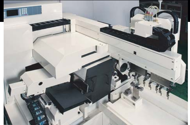
高速ローダ／高速装載装置