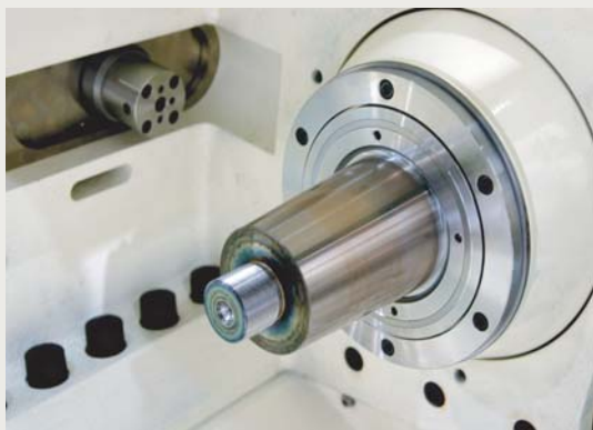
研削砥石スピンドル／砂轮主轴