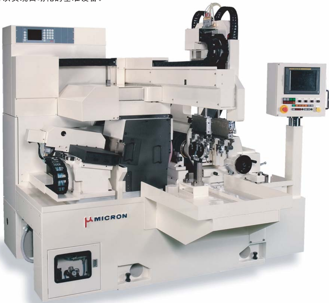
High-Speed Load/Unload System