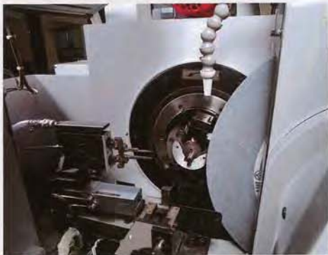
ワークチャック部