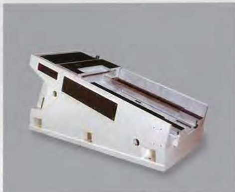
コンクリートベッド